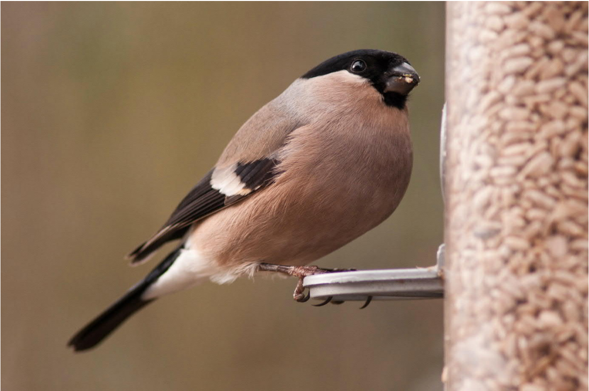
Gimpel Weibchen frisst geschälte Sonnenblumenkerne aus der Futtersäule.