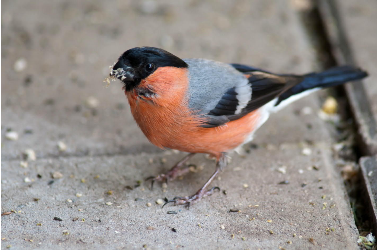
Gimpel nehmen auch gerne die Nahrung vom Boden auf ( Geschälte Sonnenblumenkerne und Negersaat )