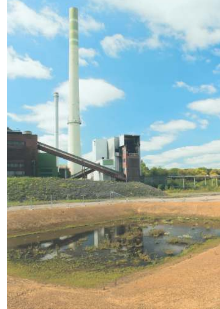
Die Tümpel auf der Industriebrache „General Blumental sind ideale Laichgewässer für Kreuzkröten, die sich in dem Gebiet in großer Zahl angesiedelt haben.

Besonders wichtig ist die Offenhaltung der Industriebrache auf General Blumenthal. Solche Lebensräume galten früher als wertlos, doch es sind Hotspots der Artenvielfalt für eine Flora und Fauna, die woanders keine Chance mehr hat. So brüten oft Flussregenpfeifer auf dem steinigen, vegetationslosen Boden. Ihren eigentlichen Lebensraum, Kiesflächen an natürlichen Flussläufen, finden sie in NRW kaum mehr. Auch die Blaufügelige Ödlandschrecke hat sich auf der Brache angesiedelt. Sie galt lange in NRW als ausgestorben mangels natürlicher offener Trockenbiotop. Für die wärmeliebenden Mauereidechsen sind die Industriebrachen ebenfalls ideale Lebensräume. Auch Kreuzkröten sind Tiere der offenen, trockenen Landschaften. Sie nutzen die Tümpel auf der Brache als Laichgewässer.