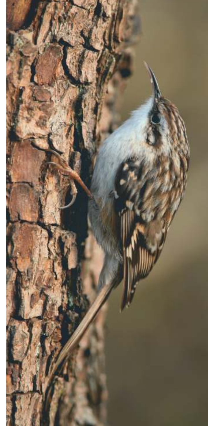
Lebensraum Wald: Gartenbaumläufer