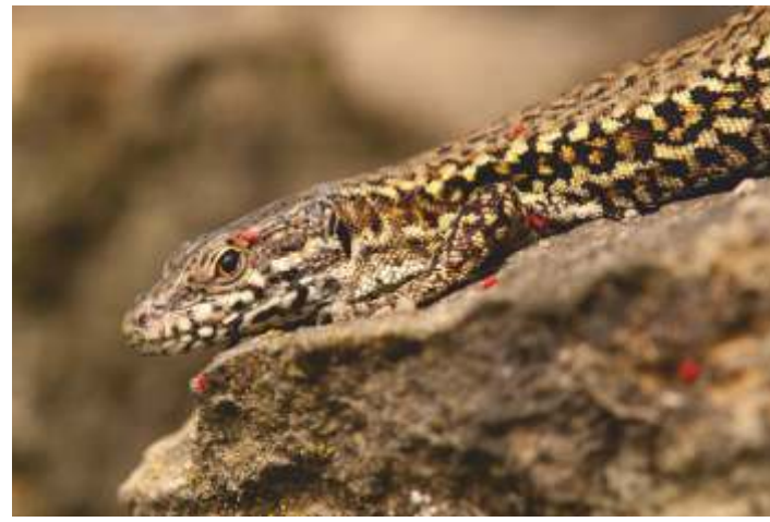
Oben: Mauereidechse; unten: Blauflügelige Ödlandschrecke, ganz unten: Flussregenpfeifer auf seinem Gelege