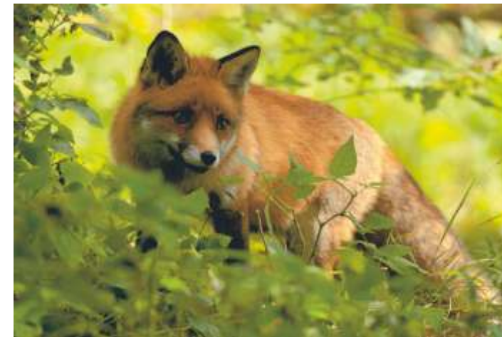
von oben: Kleiber, Buntspecht, Rotfuchs